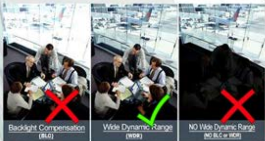
IMAGEN DE LA (ML- 5910HMWDR)